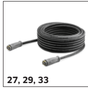
27, 29, 33